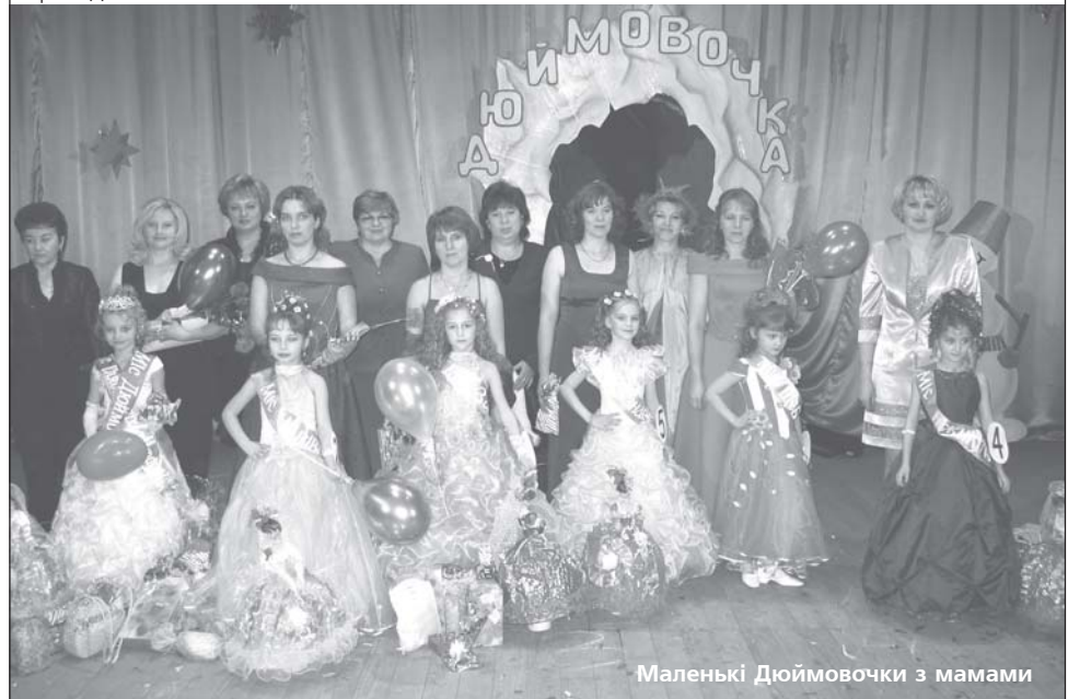
Маленькі Дюймовочки з мамами

До речі, саме глядачі відзначили професійне зростання не лише учасниць конкурсу, а і його проведення.