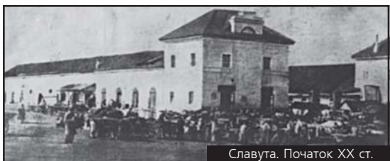
Славути. Початок XX ст.

Магдебурзьке право по всій Україні, крім Києва, де воно збереглося до 1835 року. Відтоді традиція місцевих громад вирішувати власні проблеми власними силами, на жаль, була перервана.