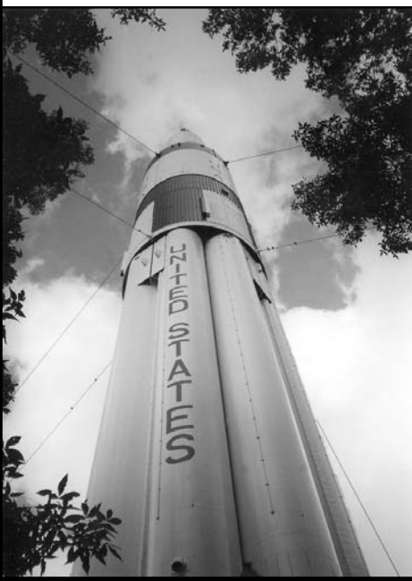
Ракета «SATURN I B» на в'їзді до штату Алабама