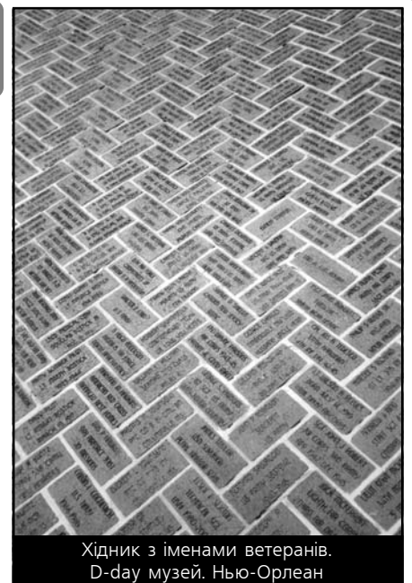
Хідник з іменами ветеранів. D-day музей. Нью-Орлеан

У першій залі музею привертають увагу манекени десяти прапороносців – від іспанця в лицарських обладунках 1541 р., французького мушкетера, солдата британських королівських сил і до офіцера в одностроях сучасної армії США. Це ті десять історичних прапорів, що