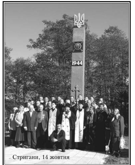
Стригани, 14 жовтня